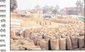
खरीदी केन्द्रों में धान खरीदी की दर एवं सूची ब फ्लैक्स